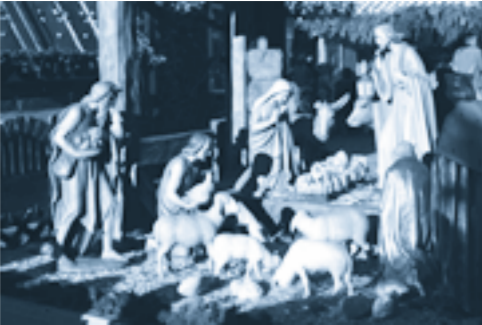
Weihnachtskrippe auf dem Schlossplatz

Erlangen präsentiert sich auch in diesem Jahr wieder von seiner besten Seite und bietet seinen Besuchern während der gesamten Adventszeit ein facettenreiches Programm.