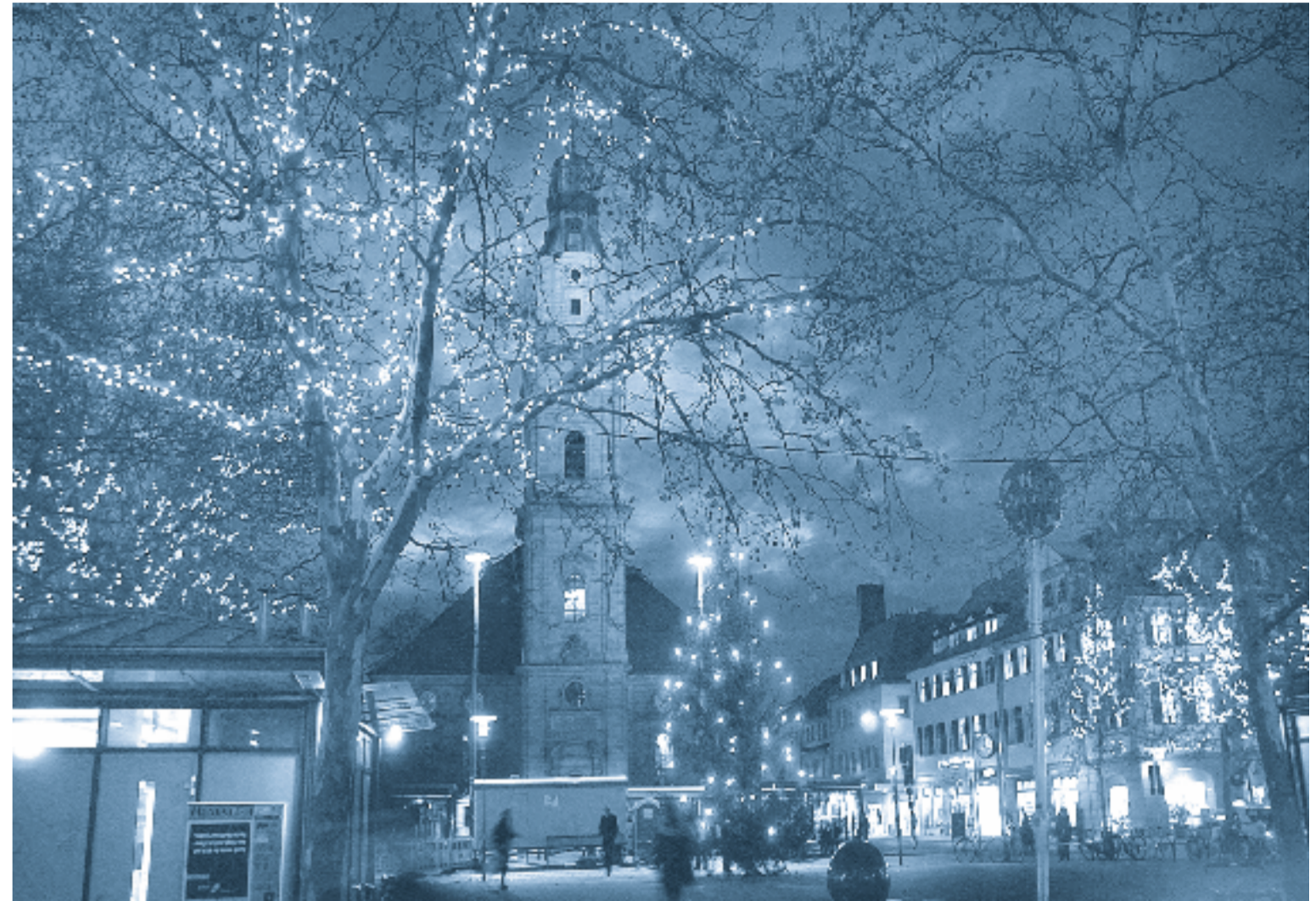
Weihnachtliche Stimmung am Hugenottenplatz, Foto: Bernd Böher