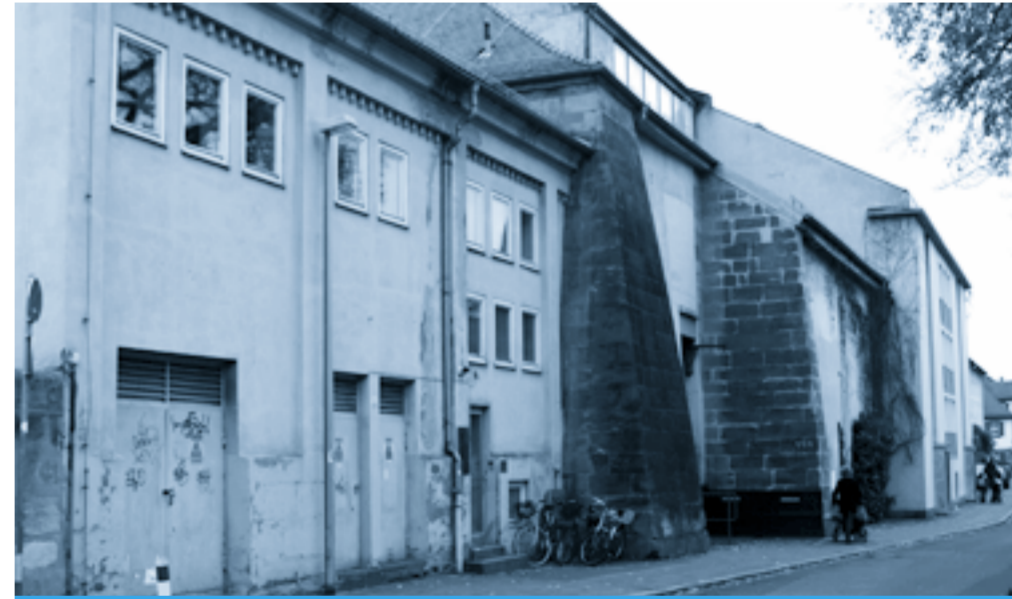
So präsentiert sich das Theater derzeit zum Theaterplatz hin.

Viele Pläne aber bisher wenig Entscheidungen bezüglich der städtischen Sanierungsprojekte