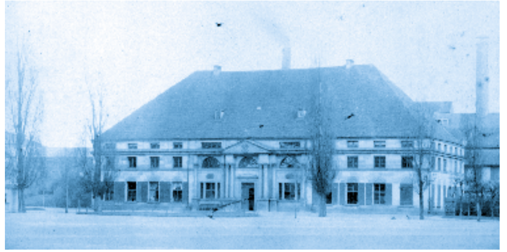
Konkordienkirche im Schlossgarten

Um 1700 gab es in der Neustadt Erlangen Französisch-Reformierte (Hugenotten), Deutsch-Reformierte aus der Rheinpfalz sowie Lutheraner und Katholiken aus allen möglichen Gegenden Deutschlands. Während das Zusammenleben trotz der sprachlichen und kulturellen Unterschiede im allgemeinen funktionierte, verstand man in Fragen der Religion keinen Spaß. In der Altstadt Erlangen schrieb der orthodoxe lutherische Pfarrer Gierbert um 1700 Traktate gegen die Reformierten in der Neustadt.