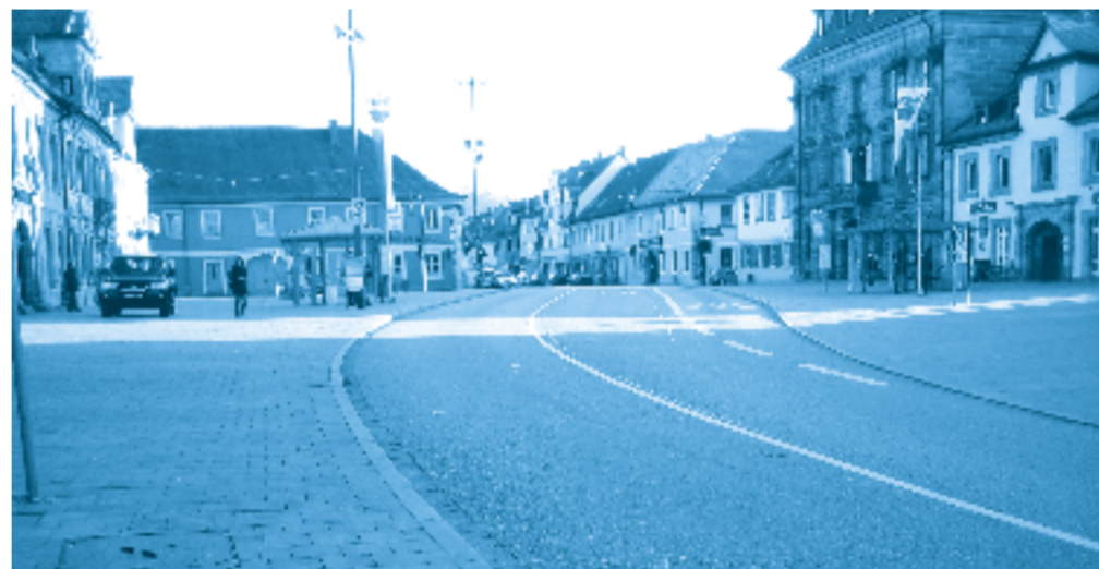
Auf die Busspur (rechts) könnte nachts ein Teil der Taxen aus der nördlichen Hauptstraße verlegt werden

In der Hauptstraße, nördlich vom Martin-Luther-Platz, ist es nach Einführung der neuen Sperrzeiten wieder ruhiger geworden. Das ist das Ergebnis des „Runden Tisch Hauptstraße“, der am 23. März nun zum 5. Mal getagt hat.