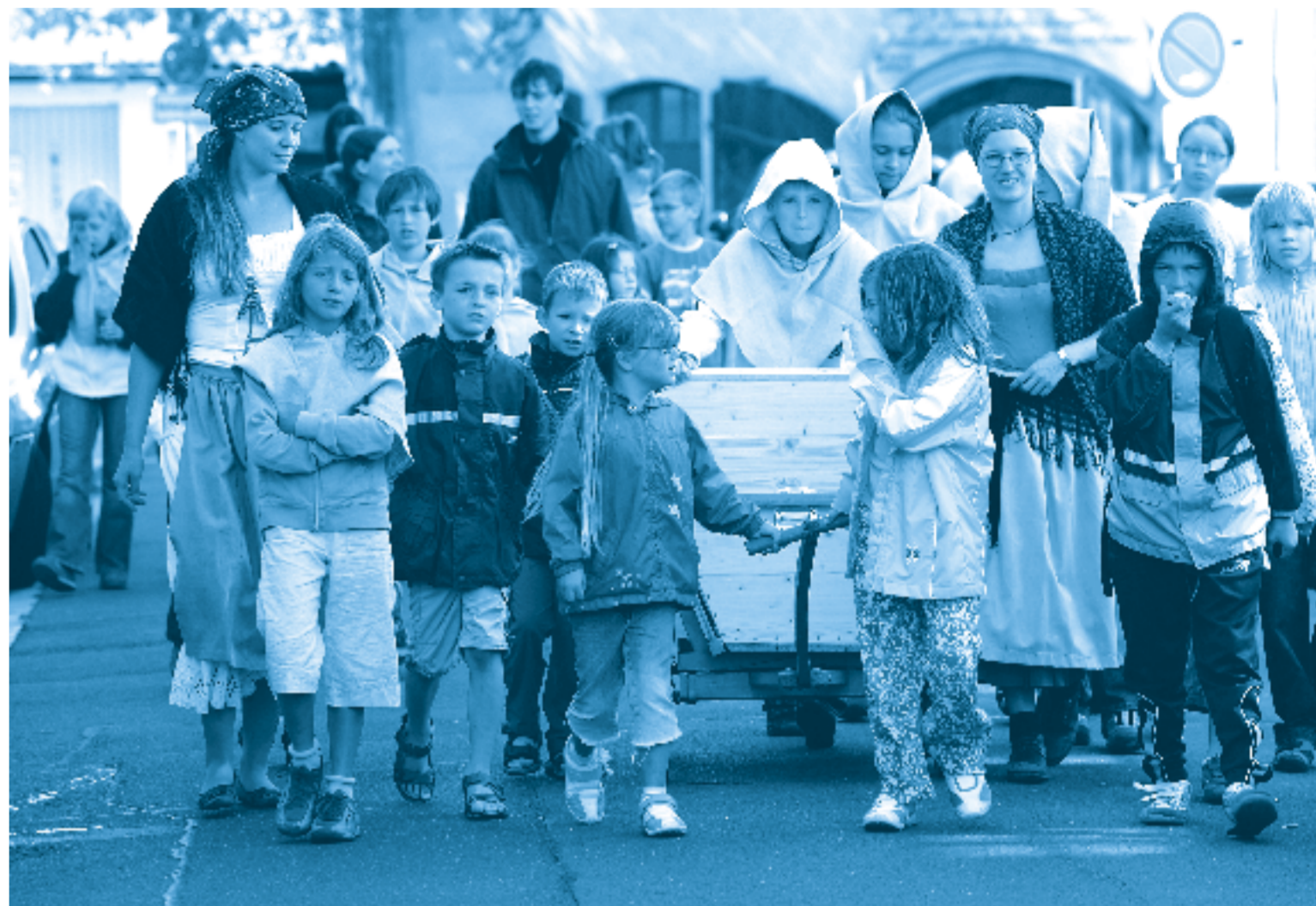
Zum „Tag der Altstadt“ am 5. Mai bietet das Stadtmuseum wieder ein kinderpädagogisches Programm an. Dazu gehört der Leiterwagen „Wenzel“, der vollgepackt mit Gegenständen und Geschichten aus der Zeit des alten „Erlang“ ist.