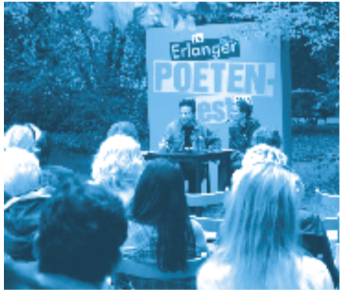
Nebenpodium im Schlossgarten 2004

Das vielleicht schönste Literaturfestival Deutschlands feiert vom 25. bis 28. August Jubiläum.