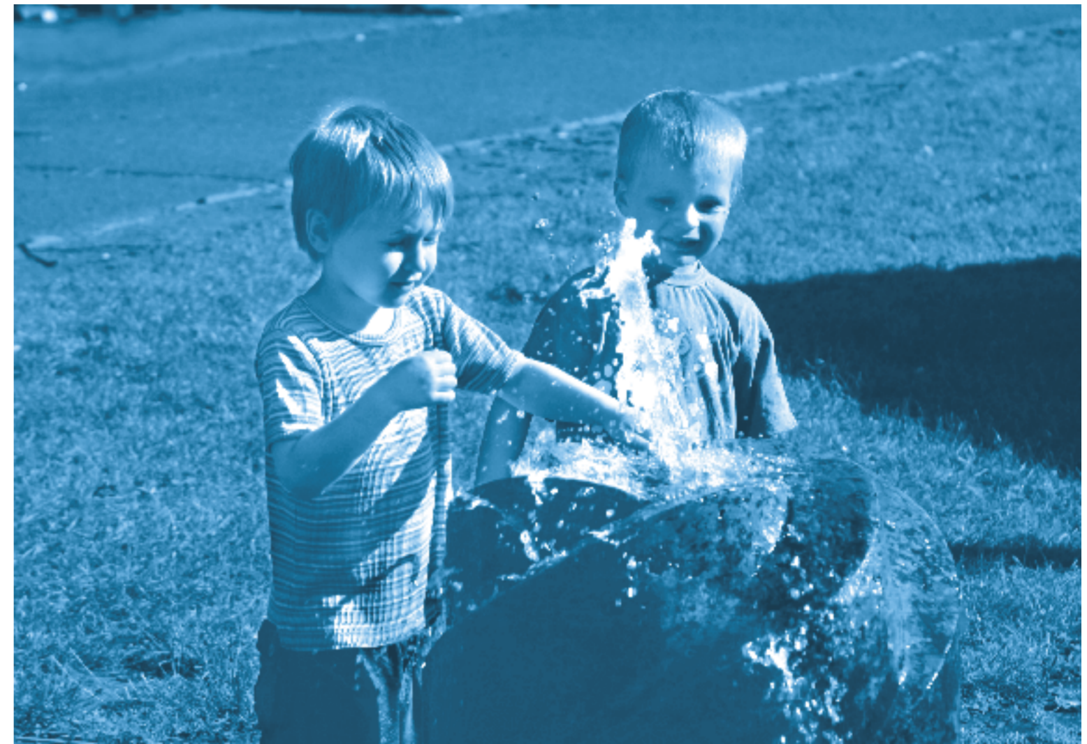
Sommerliche Wasserspiele. Der von Bernhard Reim gestiftete Theaterplatz-Brunnen erfreut sich immer wieder großer Beliebtheit.

Die „Tönende Welt“ bietet im August zwei Schnupperkurse in der „Galerie am Eck“, Engelstraße 14, an. Für 2- bis 4-Jährige: Musikalische Entdeckungsreise. Für 5- bis 7-Jährige: Experimentieren mit einfachen, selbstgebauten Instrumenten. Telefon & Fax: 9749395