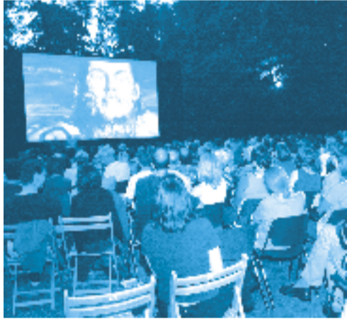
Kino unter Bäumen und freiem Himmel

Drei Wochen (vom 28. Juli bis 17. August) zeigen die Lamm-Lichtspiele „An der Bleiche“ Film-Highlights unterm Sternenhimmel.