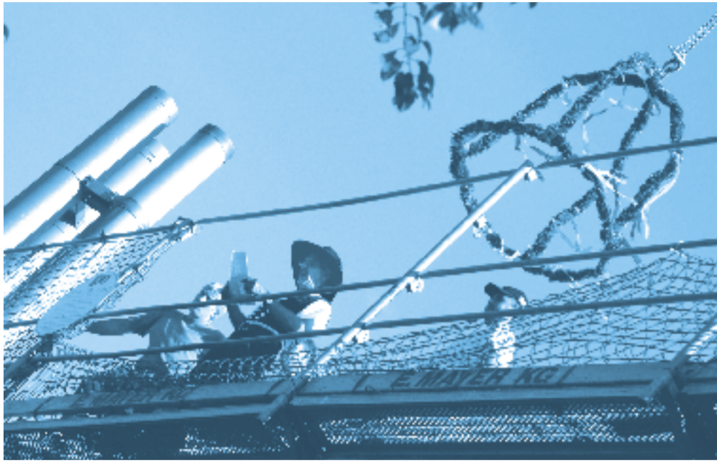
Richtspruch auf dem Dach des Mehrzweckbereichs

Mit dem am 14. September gefeierten Richtfest wurde der mit 2,16 Mill. Euro teuerste Bauabschnitt der Sanierung des E-Werkes gekrönt. Dieser umfasste vor allem die Haustechnik für den großen Saal und den