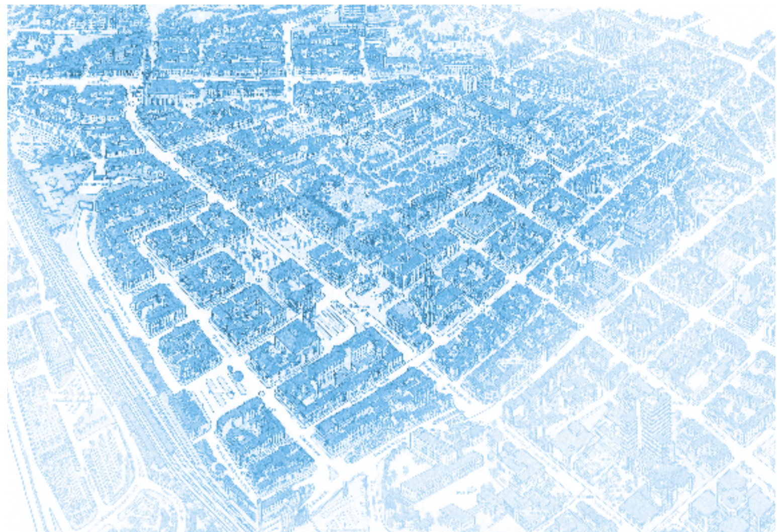
Die Altstadt, wie sie aufgrund ihres einheitlichen barocken Erscheinungsbildes heute allgemein wahrgenommen wird. Die Grenzen orientieren sich ungefähr an den vier Stadtmauerstraßen und umfassen damit die gesamte historische Innenstadt.